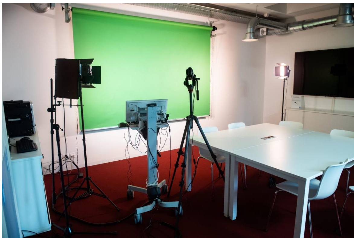
Un studio d'enregistrement permet aux intéressés de faire du son et de la vidéo.

Les professeurs, quant à eux, peuvent s'exercer grâce à un bureau prototype, représentant l'avant d'une salle de classe. La honte liée à la non-maîtrise des outils informatiques, c'est fini!